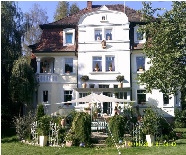
Seminarort: „Kurhaus Gifting“ Übernachtung möglich Weitere Informationen bei Ute